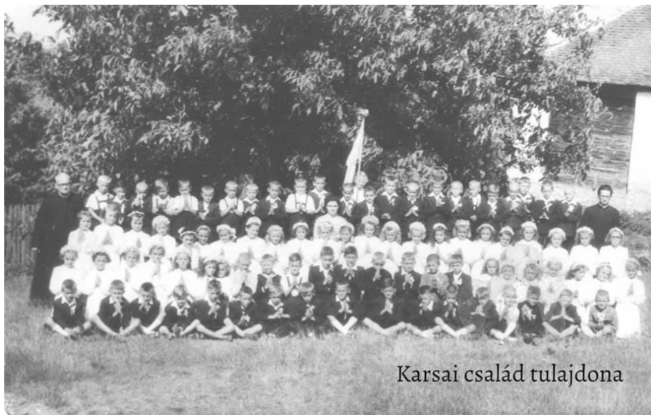
2. slika: Prvo obhajilo otrok iz Zside, Magyarlaka in Kethelya. maj 1957

Ni bil takšen duhovnik, da so otroci prišli, zdaj pa molimo - to je imelo svoj prostor - igral se je z njimi, igrali so nogomet. Župnija je imela spodnje in zgornje dvorišče, tam je igral nogomet s fanti, ko so prišli. Včasih so prišla tudi dekleta, da bi se igrala.