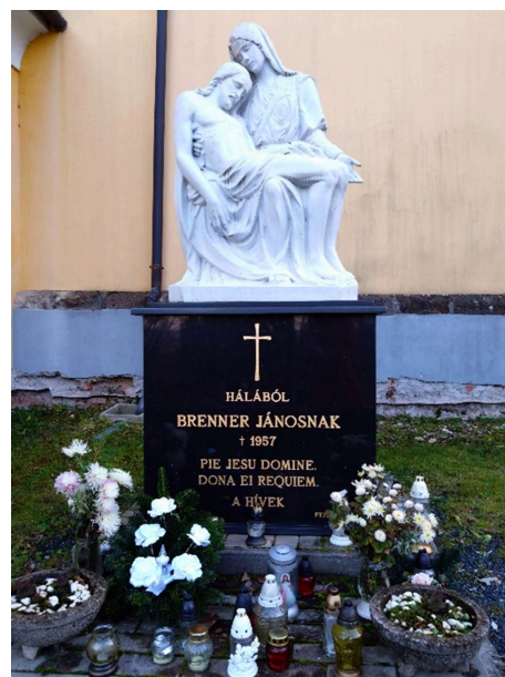
1. slika Pietá na pokopališču v Rábakethelyju